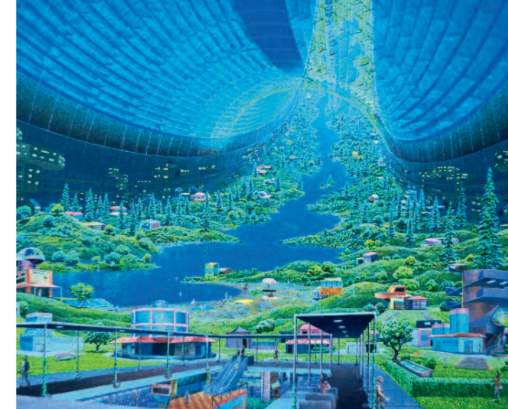
Computermodell einer planetarischen Stadt

richtung der Wirtschaftsmacht wieder umkehren: »Durch ein präzises Verständnis von Genen und Genomen können wir Pflanzen gezielt statt durch Versuch und Irrtum so verändern, dass sie höhere Erträge bringen, besseren Nährwert haben und gegen Krankheiten resistent sind.«