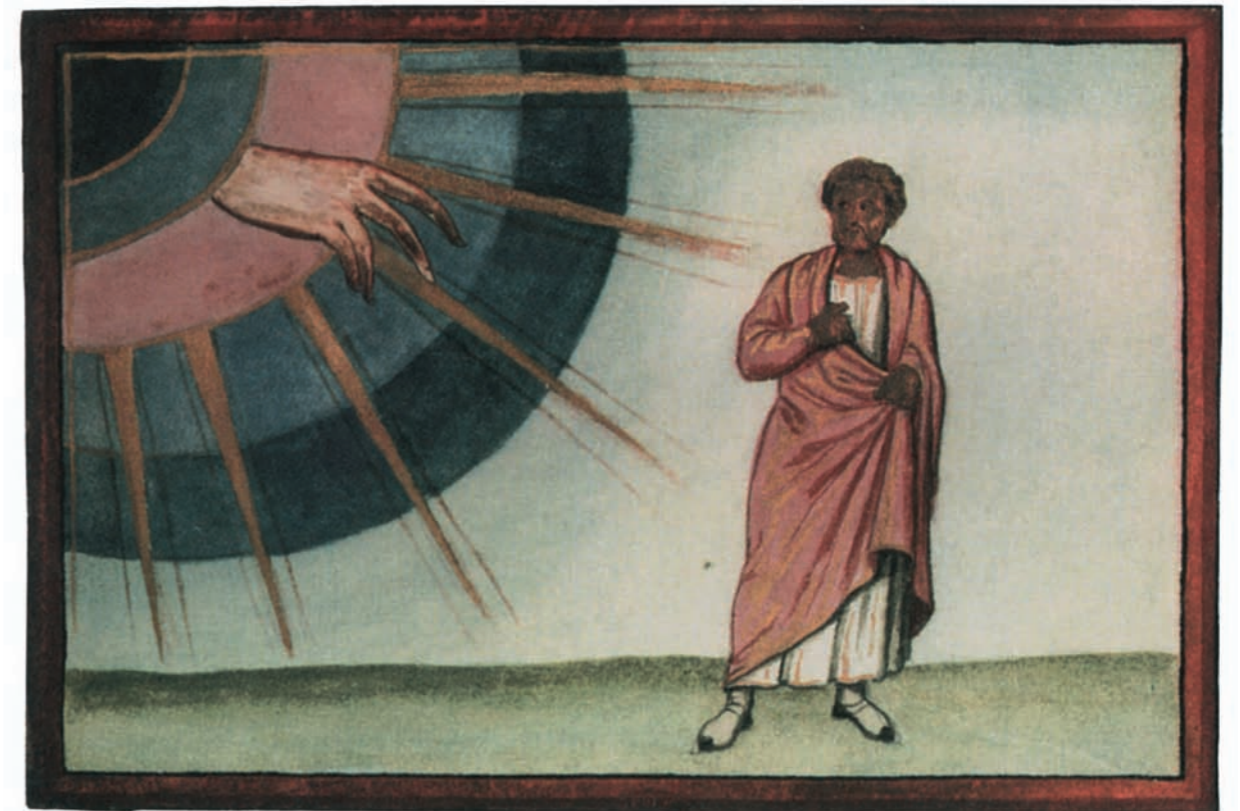
Handschrift des 6. Jahrhunderts, Genesis, Gott spricht im Symbol des dunklen, kreisförmigen Regenbogens, der Strahlen und der Hand zu Abraham