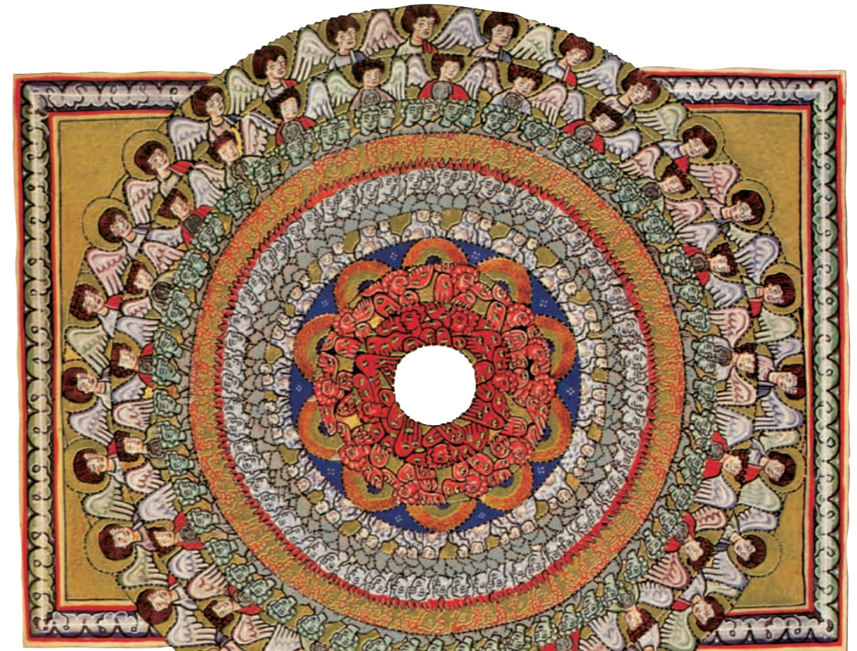
Hildegard von Bingen (1098–1179), Die neun Chöre der Engel, aus dem Rupertsberger Codex, der 1147 unter Anleitung der Äbtissin angefertigt wurde. Das mystische Symbol zeigt, wie die Chöre der Engel in konzentrischen Kreisen um die bildlose Mitte angeordnet sind (→ S. 101)

❖ Gottesbilder selbst waren aber zu Anfang streng verboten , da die Christen vom Judentum den Dekalog übernommen hatten. Eigentlich hätte also auch in der Christenheit das Bilderverbot weiter Bestand haben müssen. Das war aber nicht durchgängig der Fall. In der antiken Welt des Mittelmeers, in die das junge Christentum eintrat, hatten Götterbilder einen hohen religiösen Stellenwert. Eine Religion ohne alle Gottesbilder erschien vielen als völlig undenkbar. Manche dachten sogar, dass man ohne Gottesbilder nicht religiös sein könne. So drangen in der griechisch-römischen Welt insbesondere nach der Konstantinischen Wende (4. Jh.) langsam auch Gottesbilder in das Christentum ein. Sie zeigen Gott oft im Bild Christi.