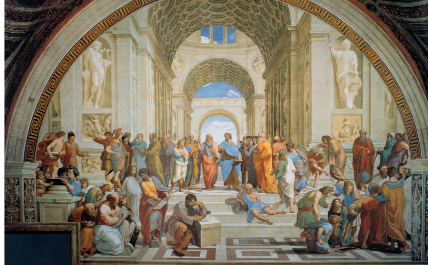
Raffael (1493–1520), Die Schule von Athen (1510–1511). Fresko in den Stanzen des Vatikan. Das Bild zeigt die bedeutenden griechischen Philosophen der Antike. Es betont die Bedeutung der Vernunft für die Theologie. In der Mitte: Platon und Aristoteles. Unten rechts am Rand die zweite Person von rechts: Raffael, und im Vordergrund, den Kopf aufgestützt, Michelangelo.